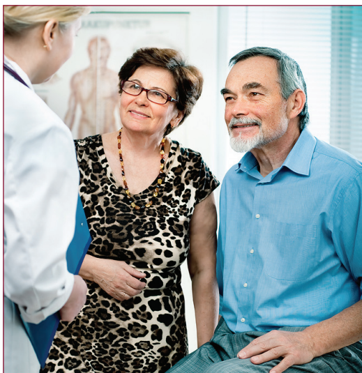
Mynd 1. Nýjar skilgreiningar á mergæxli og forstígrum þess

Til eru forstígr mergæxla sem hægt er að greina áður en sjúkdómurinn gerir vart við sig. Myndun mergæxlis getur tekið mörg ár. Snemmbúnasta