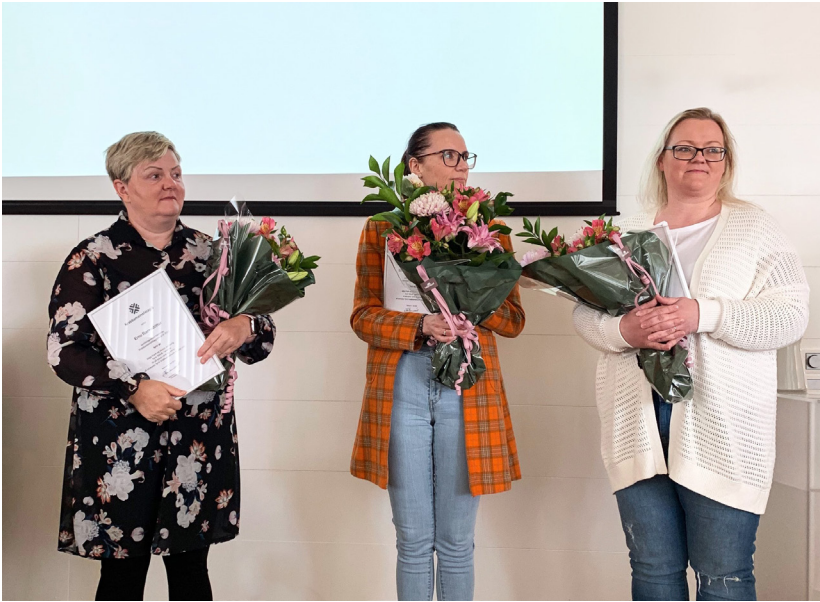
Frá afhendingu Samfélagsviðurkenningar Krabbameinsfélagsins